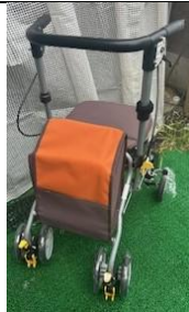
商品名：シンフォニーSPスリム