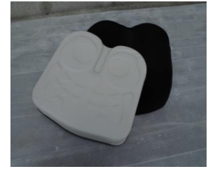
商品名：アウル REHA レギュラー