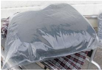
商品名：アウル REHA3D ジャスト