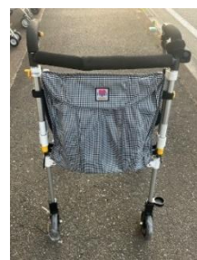
商品名：ヘルシーワンキャンシットLG