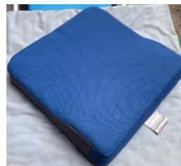
商品名：シーボスクッション