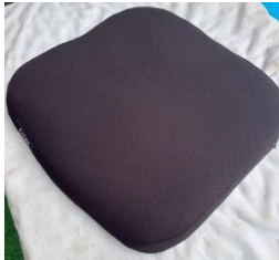
商品名：アウルサポートクッション