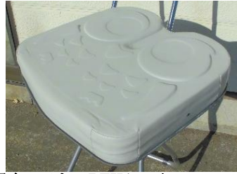
商品名：アウル REHA ハイ