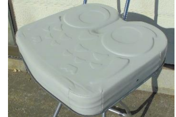
商品名：アウル REHA ハイ