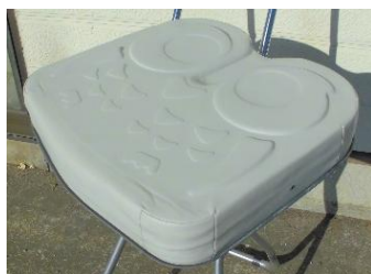
商品名：アウル REHA ハイ