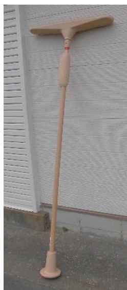
【クロスバーセット】