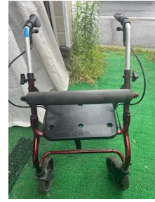
商品名：セーフティーアームローターⅡ