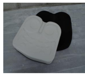
商品名：アウル REHA レギュラー