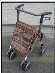
商品名：シンフォニーSP