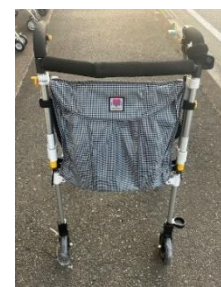
商品名：ヘルシーワンキャンシット LG