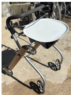
商品名：レッツゴー