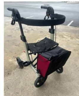
商品名：歩行車リトルターン（ハイ）