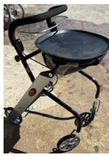
商品名：レッツゴーミニ