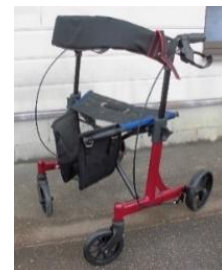
商品名：レンタコムウォーカー（小）