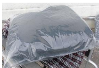
商品名：アウル REHA3D ジャスト