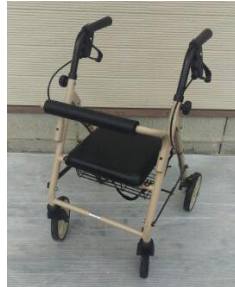
商品名：ハッピーミニ