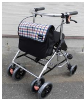
商品名：テイコブリトル